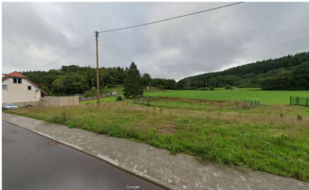
Auszug Google Street View