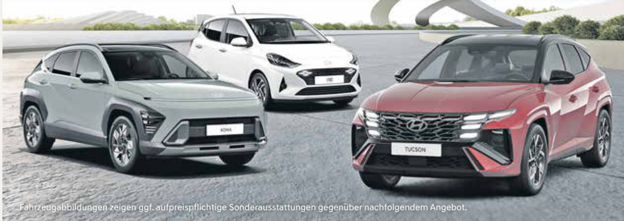
Fahrzeugabbildungen zeigen ggf. aufpreispflichtige Sonderausstattungen gegenüber nachfolgendem Angebot.

Jetzt noch Top-Angebote bis 30.06.2024 sichern